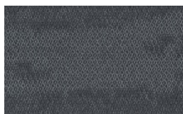
003 - Tiempo